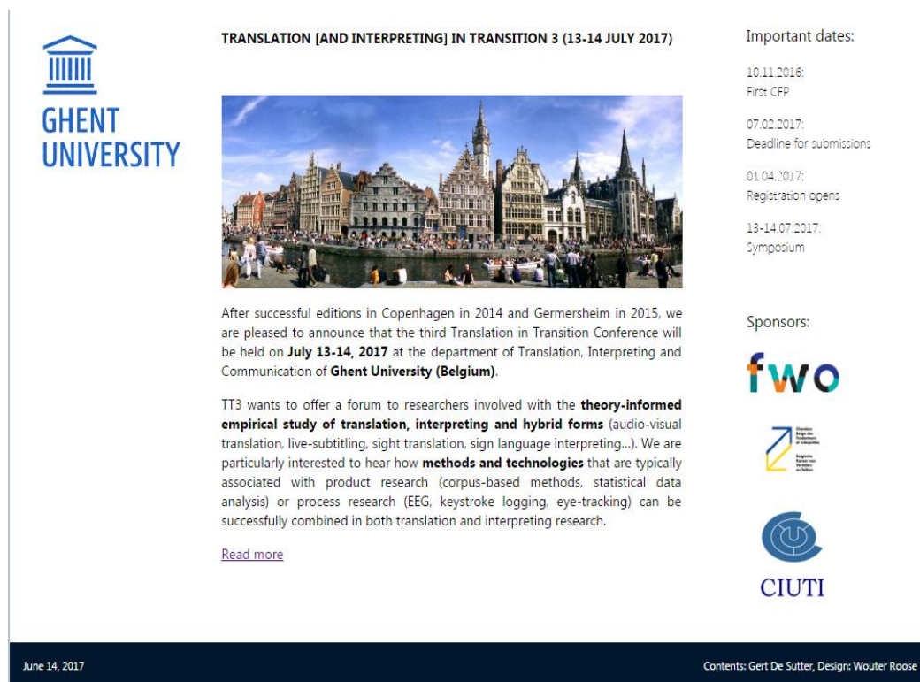
Figura 2 – Imagem da divulgação do evento Translation [and Interpreting] in Transition 2017